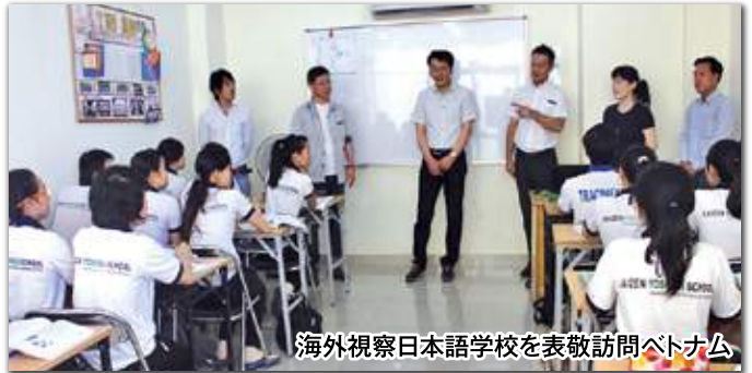
海外視察日本語学校を表敬訪問ベトナム