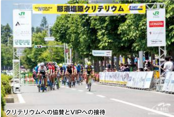
クリテリウムへの協賛とVIPへの接待

また、メンバー企業合同での社員研修も実施し、社員同士の交流も行っています。定例会の見学希望は事務局までご連絡下さい。