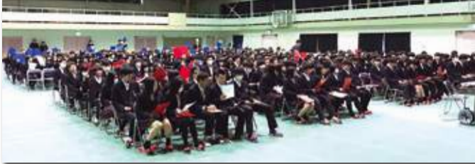
▲黒磯南高校にて開催しているパネルディスカッションは通算11回。厚崎中学校他でも開催。